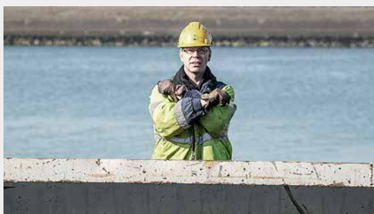
Stoppen met laden. Deze aanwijzing wordt gegeven als alleen de uithouderband leeg gedraaid moet worden om de machine naar volgende ruim te verkassen of naar de volgende bak of lichter. Na deze aanwijzing krijgt men een aantal tonnen van deze band. Voor de binnenste bak (schip) is dat ca. 15 ton, voor de buitenste bak (schip) ca. 25 ton.