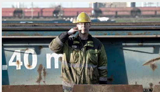
Afbestellen (leegdraaien van alle aanvoerende banden). Maak een beweging van het opnemen van een telefoon, met het draaien van de hand kunnen de aanwijzing verduidelijken.