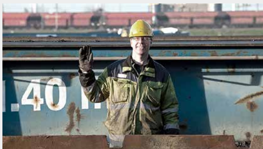
Stoppen van de beweging.