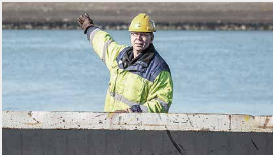
Uithouder naar buiten telescoperen