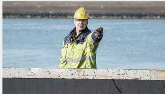
Uithouder naar binnen telescoperen